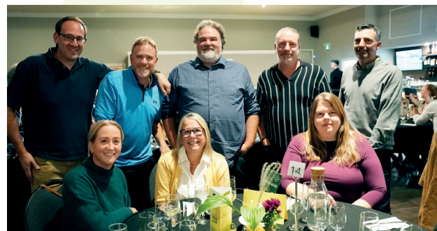
Les pros ont troqué le crayon pour le bâton.