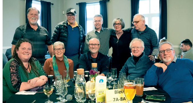
Une table tirée au sort.

Et que dire du trou Shevas et Mélo Festival, où un rafraîchissement bien mérité nous était offert au profit de la Fondation du Collège de l'Assomption.