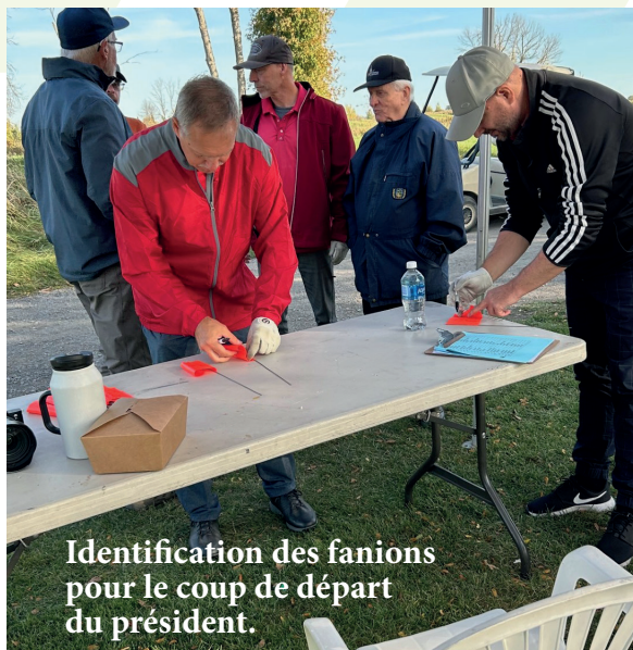
Identification des fanions pour le coup de départ du président.

Certains trous se démarquaient par leur créativité et ont ajouté une touche unique à l'événement.