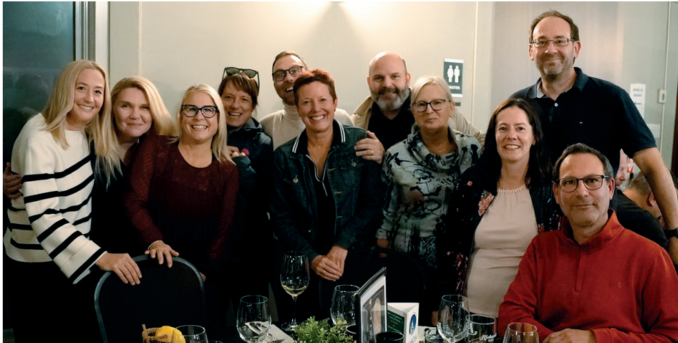
Quelques membres du personnel du Collège.