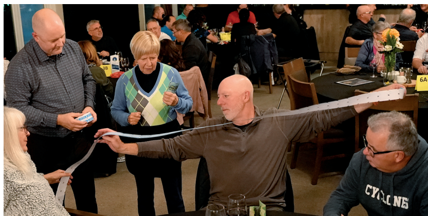
La vente des coupons pour les tirages est toujours populaire.