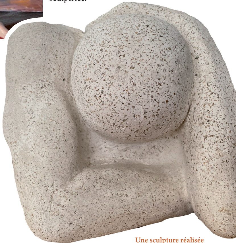
Une sculpture réalisée en tant qu'élève du Collège de l'Assomption

« J'ai toujours gardé le goût pour la chose artistique », poursuit-elle. « Mes cahiers de notes de cours étaient remplis de dessins que je m'amusais à faire pendant mes pauses.