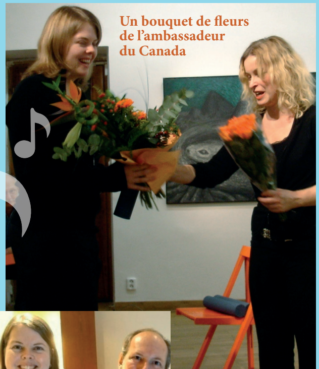
Un bouquet de fleurs de l'ambassadeur du Canada