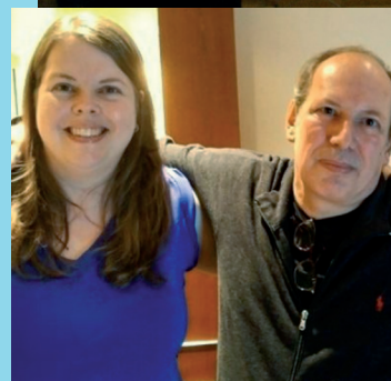
Une rencontre avec le légendaire compositeur Hans Zimmer ( The Lion King , Gladiator , Inception et Dune )

Valérie détient un baccalauréat en composition électroacoustique de l'Université de Montréal, une AEC en conception sonore du Cégep de Drummondville et une formation en piano classique du Cégep de Joliette.